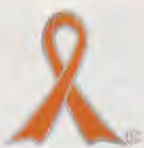
「子ども虐待防止シンボルマーク」